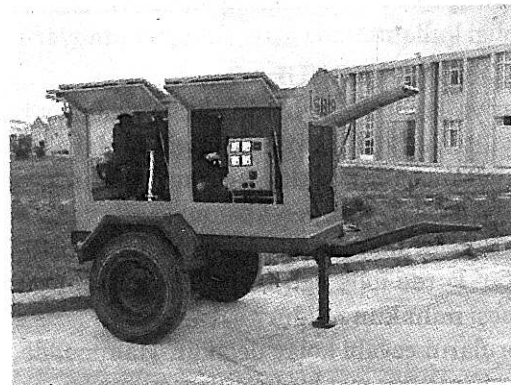
Dizel Motorlu Kaynak Jeneratörü

1990 Ağustos ayının başından beri yükselen petrol fiyatları ekonomimizde toplam arzın düşmesine neden olmuş ve bunun sonucu olarak Türk ekonomisinde bir arz enflasyonu olgusu ortaya çıkmıştır. Bu sırada fiyatlar yükselirken istihdam düzeyinde de bir düşme olmaktadır.